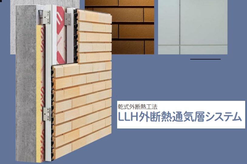
乾式外断熱工法 LLH外断熱通気層システム

その「圭」をアーティストックに変化させたアートパネル「A-rto K(アールトケー)」。更に初お披露目になる次回の新製品モックアップも展示。